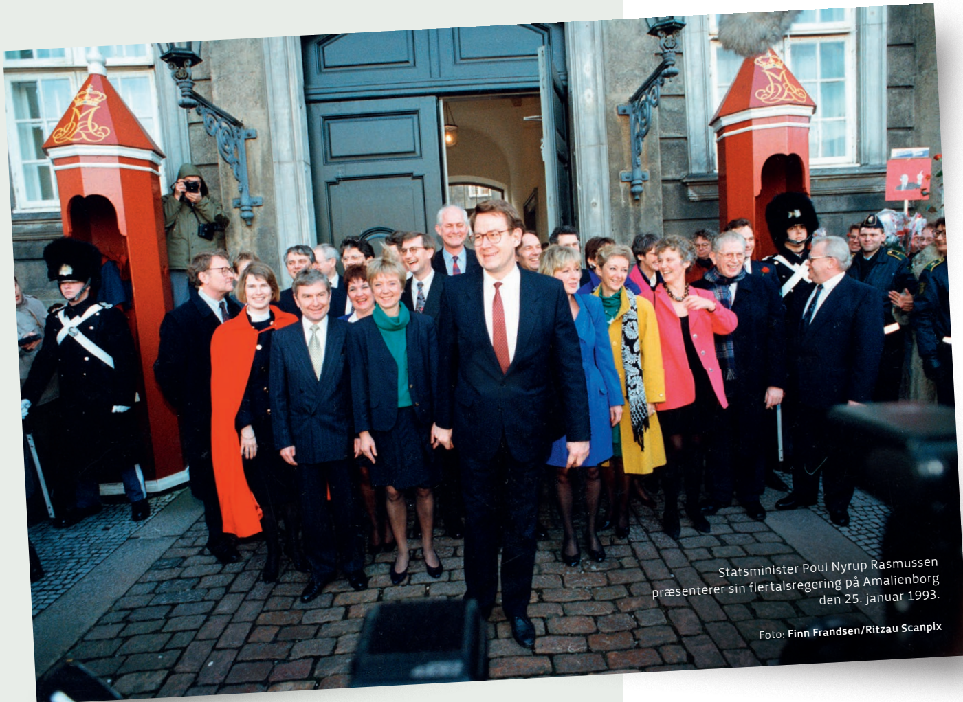
Statsminister Poul Nyrup Rasmussen præsenterer sin flertalsregering på Amalienborg den 25. januar 1993.