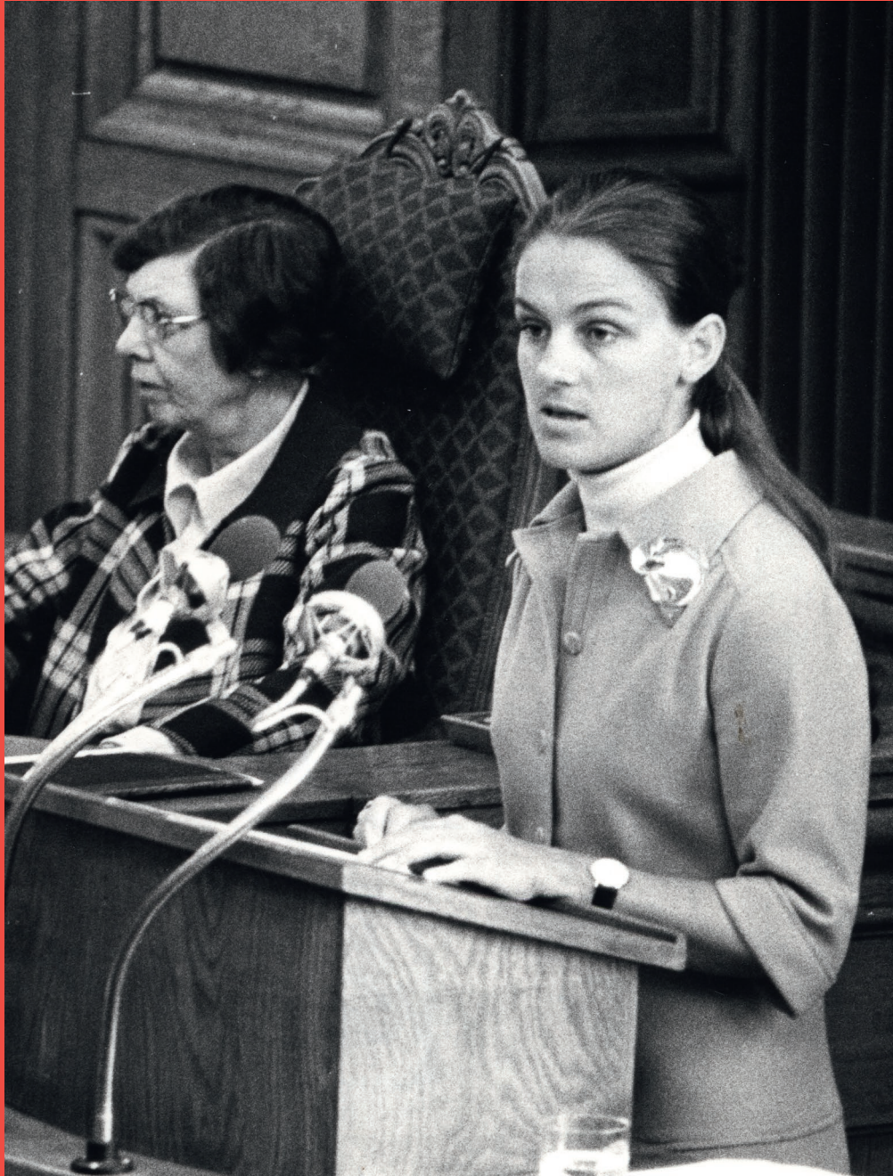
Undervisningsminister Ritt Bjerregaard på talerstolen under en debat i Folketinget i 1976.