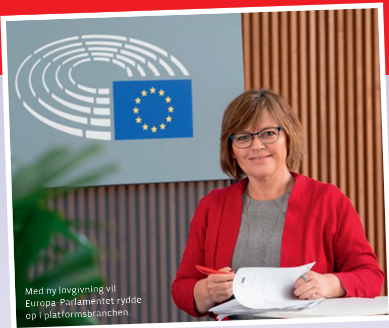
Med ny lovgivning vil Europa-Parlamentet rydde op i platformbranchen.