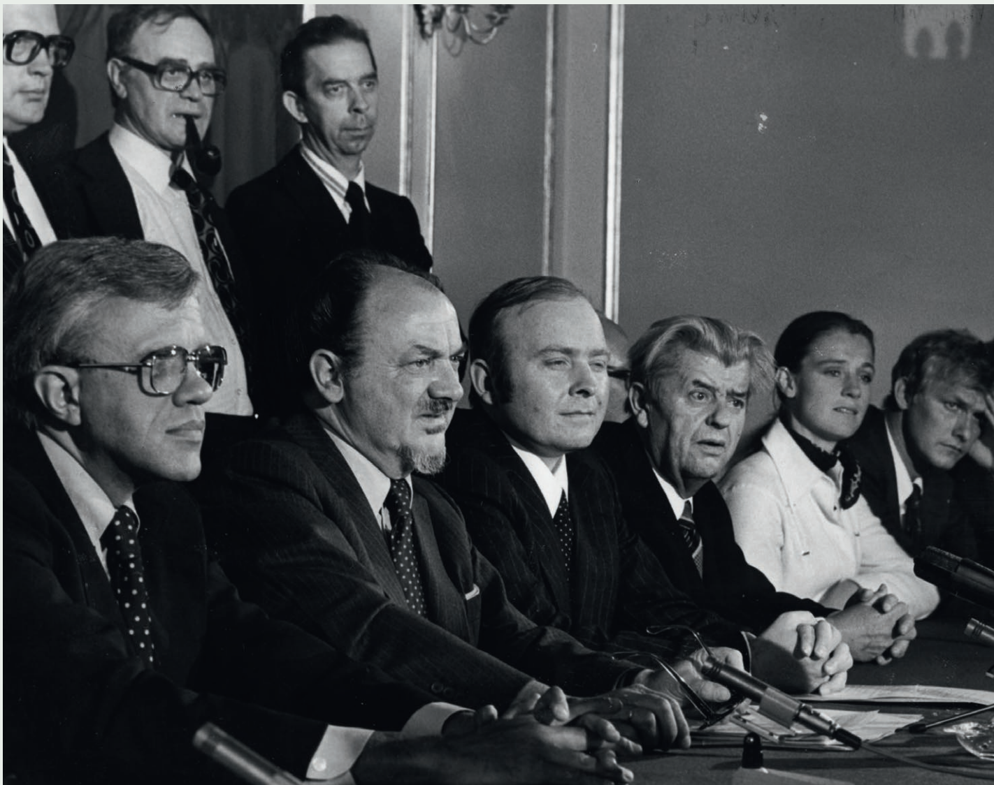
Anker Jørgensen præsenterer sin SV-regering 30. august 1978. I forreste række ses fra venstre finansminister Knud Heinesen, statsminister Anker Jørgensen, Venstres formand og udenrigsminister Henning Christophersen, minister uden portefølje Per Hækkerup, undervisningsminister Ritt Bjerregaard og arbejdsminister Svend Auken.