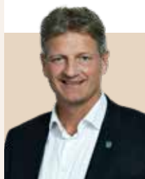
Borgmester i Ballerup Kommune siden 2012