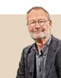
Borgmester i Ærø Kommune siden 2022 - nvalgt