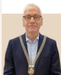
Borgmester i Holstebro Kommune siden 2010