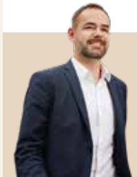
Borgmester i Aarhus Kommune siden 2011