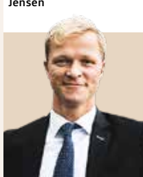
Borgmester i Middelfart Kommune siden 2017