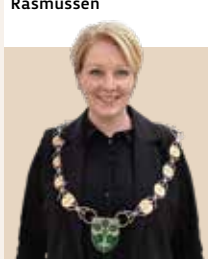
Borgmester i Egedal Kommune siden 2022 - nvalgt