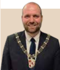
Borgmester i Herlev Kommune siden 2011