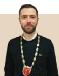
Borgmester i Glostrup Kommune siden 2022 - nvalgt