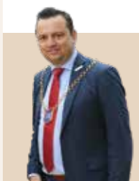
Borgmester i Skanderborg Kommune siden 2019