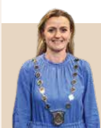
Borgmester i Odder Kommune siden 2022 - nvalgt