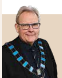
Borgmester i Albertslund Kommune siden 2010