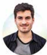
AF FREDERIK VAD NIELSEN, FORBUNDSFORMAND FOR DANMARKS SOCIALDEMOKRATISKE UNGDOM (DSU)