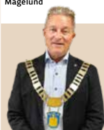
Borgmester i Brøndby Kommune siden 2016