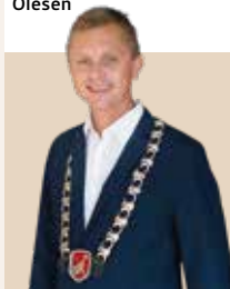
Borgmester i Kerteminde Kommune siden 2018