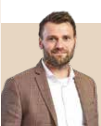
Borgmester i Syddjurs Kommune siden 2022 - nvalgt