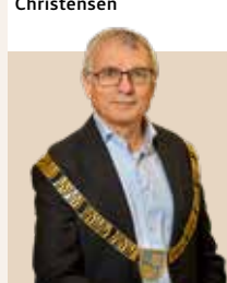
Borgmester i Furesø Kommune siden 2010