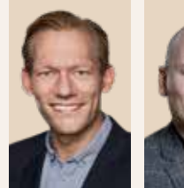
Formand for Region Sjælland siden 2018