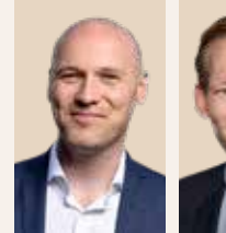
Formand for Region Midtjylland siden 2018