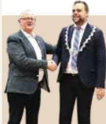
Borgmester i Halsnæs Kommune siden 2018