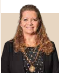
Borgmester i Silkeborg Kommune siden 2022 - nyvalgt