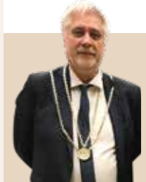
Borgmester i Faaborg-Midtfyn Kommune siden 2018