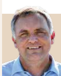
Borgmester i Samsø Kommune siden 2014