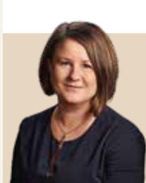
Borgmester i Ishøj Kommune siden 2022 - nvalgt