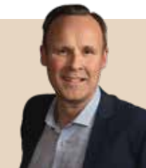
Borgmester i Tårnby Kommune siden 2018