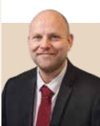
Borgmester i Vordingborg Kommune siden 2018