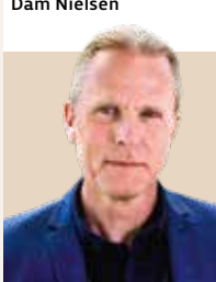
Borgmester i Stevns Kommune siden 2022 - nyvalgt