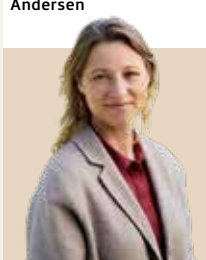
Borgmester i Københavns Kommune siden 2022 - nvalgt