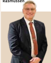
Borgmester i Lolland Kommune siden 2014