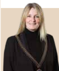
Borgmester i Frederikshavn Kommune siden 2014