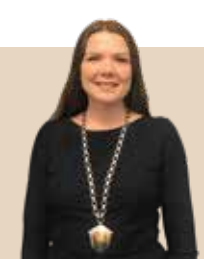
Borgmester i Køge Kommune 2007-13 og igen siden 2018