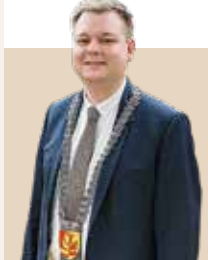
Borgmester i Guldborgsund Kommune siden 2022 - nvalgt