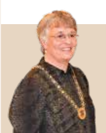
Borgmester i Gladsaxe Kommune siden 2017