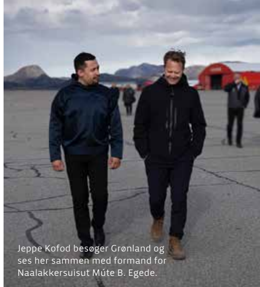
Jeppe Kofod besøgte Grønland og ses her sammen med formand for Naalakkersuisut Múte B. Egede.

Klimaforandringer, Ruslands fremfærd og samarbejdet i Rigsfællesskabet. Det var blandt emnerne, da Socialdemokratiets hovedbestyrelse i januar drøftede situationen i Arktis med daværende forsvarsminister Trine Bramsen og udenrigsminister Jeppe Kofod.