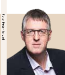
Borgmester i Sønderborg Kommune siden 2014