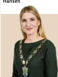
Borgmester i Holbæk Kommune siden 2018