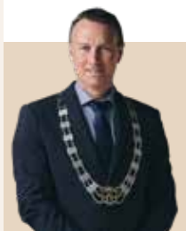
Borgmester i Næstved Kommune siden 2011