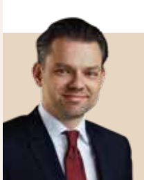
Borgmester i Frederiksberg Kommune siden 2022 - nvalgt