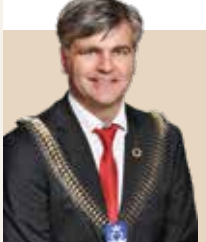
Borgmester i Fredensborg Kommune siden 2010