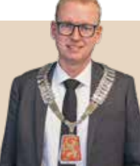
Borgmester i Fredericia Kommune siden 2021