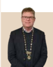
Borgmester i Randers Kommune siden 2018