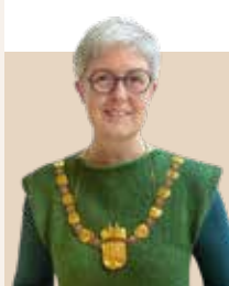
Borgmester i Hillerød Kommune 2007-13 og igen siden 2018