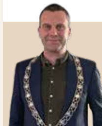
Borgmester i Svendborg Kommune siden 2018