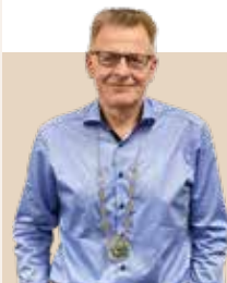
Borgmester i Horsens Kommune siden 2012